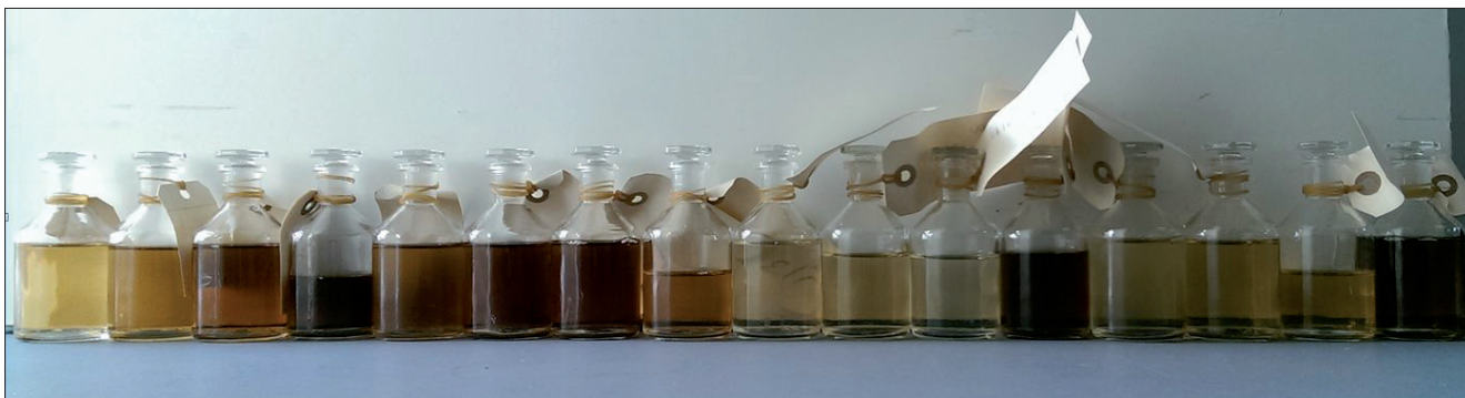
Figur 5 – Grundvandsprøver fra Tvørup Hul taget i 1,25 m dybde ca. 5 m fra søbredden hele vejen rundt om søen. Vandets indhold af farvet organisk stof er meget forskelligt afhængigt jordbundsforhold og vegetationstype i det område hvor grundvandet dannes.