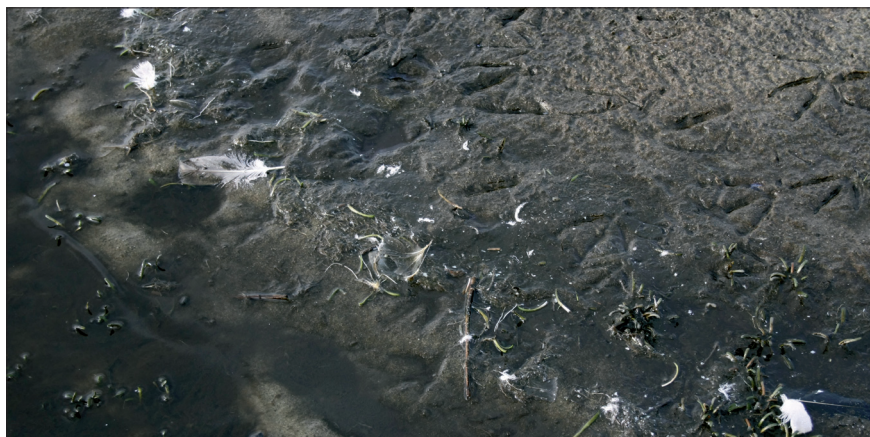
Figur 3 – Gåselort, gåsespor, gåsefjer, slam og døende tvepibet lobelie. Billedet er fra Ålvand i Nationalpark Thy, hvor rastende gæs tilfører store mængder næringsstoffer fra det omkringliggende landbrugsland.

Hampen Sø er en af Danmarks største overlevende lobeliesøer. Den er et eksempel på, hvor stor betydning indsvivende grundvand kan have på næringsbalancen. Søen modtager grundvand i den nordlige og nordøstlige ende og søvandet forsvinder igen til grundvandet i den vestlige ende /10/. Indsvivningsområdet indeholder både skov og landbrug. Det indsvivende grundvand fra skoven er næringsfattigt, men meget næringsrigt fra markerne (op til 56 mg NO_3^- N per liter) /11/. Kvælstoffet bidrager sammen med fosfor til øget vækst af planteplankton og trådalger, som lægger sig som en grøn skyggende måtte hen over grundskudsplanterne. En stor del af det tilførte fosfor forbliver i søen og aflejres i bunden på søens dybe del, hvorfra det kan frigives om som-