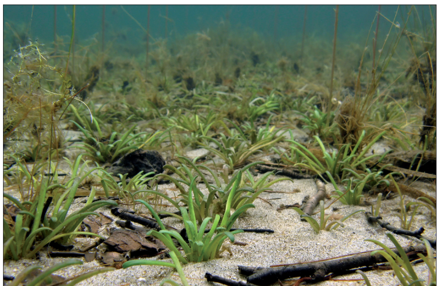
Figur 1 – Tvepibet lobelie ( Lobelia dortmanna ) på ren og fin sandbund. Når sedimentet slammer til i forbindelse med eutrofiering, danner planterne små korte rødder og de taber rodfæste i det vandfyldte sediment.

Hvis sedimentet ikke længere er egnet som voksested for de følsomme grundskudsplanter, kan søerne restaureres ved at fjerne det øverste mudrede sedimentlag ned til den oprindelige sandbund, eller i en periode sænke vandstanden for at øge nedbrydningen af det organiske stof. I Danmark har man med succes fjernet sediment i Ål Præstesø sydvest for Varde, så tvepibet lobelie kunne genindvandre /6/. I Holland har man i flere søer fremmet genetablering af strandbo ved ligeledes at fjerne de øverste cm af sedimentet,