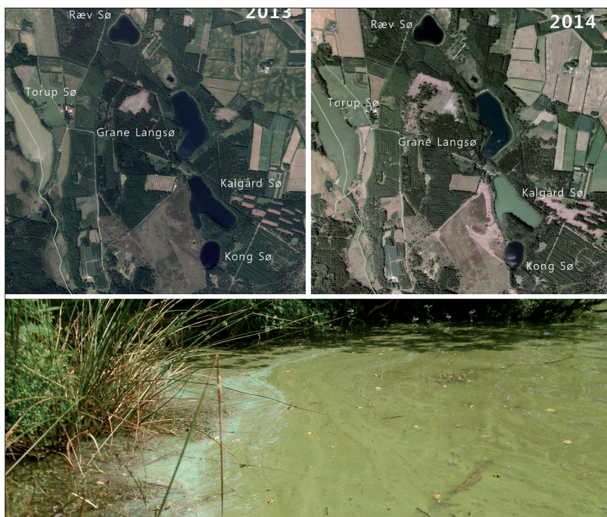
Figur 4 – Luftfoto over Tingdal-søerne fra 2013 (venstre) og 2014 (højre), som viser hvordan Kalgård Sø har skiftet farve fra det ene år til det andet. I 2013 havde alle fire lobeliesøer samme blå overflade, mens Kalgård Sø i 2014 havde samme farve som den eutrofe nabosø, Torup Sø. Nederst billede af littoralzonen i Kalgård Sø, juli 2015.

Naturstyrelsen har taget forskellige initiativer for at reducere brunfarvningen af Tvorup Hul, bl.a. ledes det meget brune drænvand fra fyrreplantagen nu udenom søen. Men søen tilføres fortsat mange humusstoffer med det indsvivende grundvand, og det nedbrydes kun langsomt af solens UV lys ude i søen. UV nedbrydninger resulterer trods alt i mindre brunfarvning af søvandet om sommeren end om vinteren (Figur 6). Det er svært at se andre indgreb i oplandet til at mindske søens brunfarvning end at omlægge fyrreplantagen til hede måske i kombination med et yderligere omløbsdræn, så vandets opholdstid i søens forlænges yderligere for at forstærke UV-blegningen.